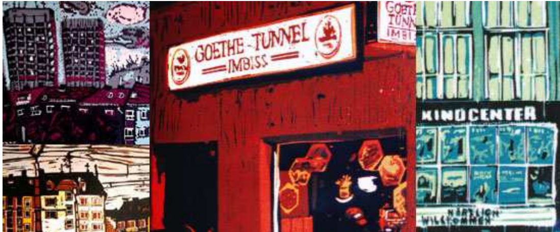
(Bildtext: Kleine Ausstellungen im Gutenberg-Museum Mainz)