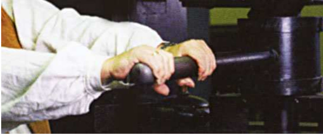
(Bildtext: Die 'Gutenberg-Pressen' in Aktion)