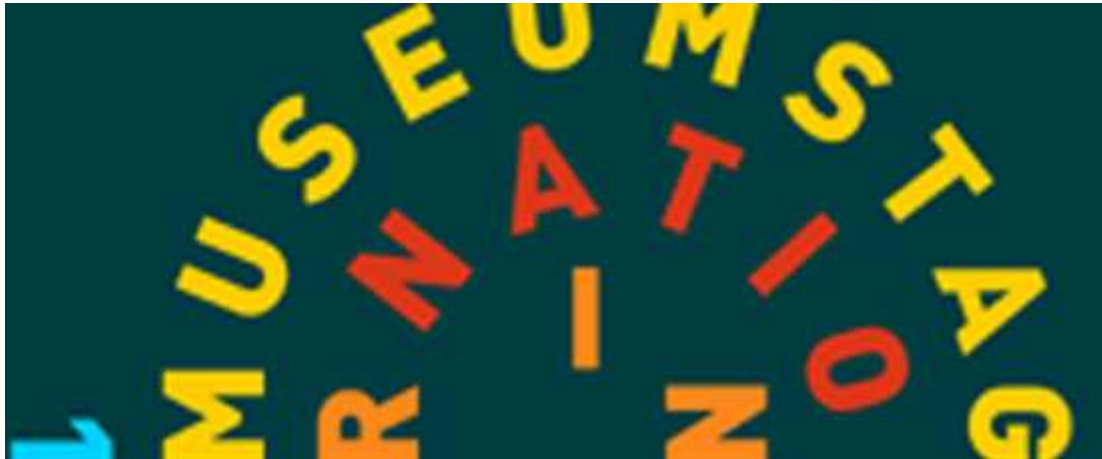
(Bildtext: Internationaler Museumstag im Gutenberg-Museum Mainz)