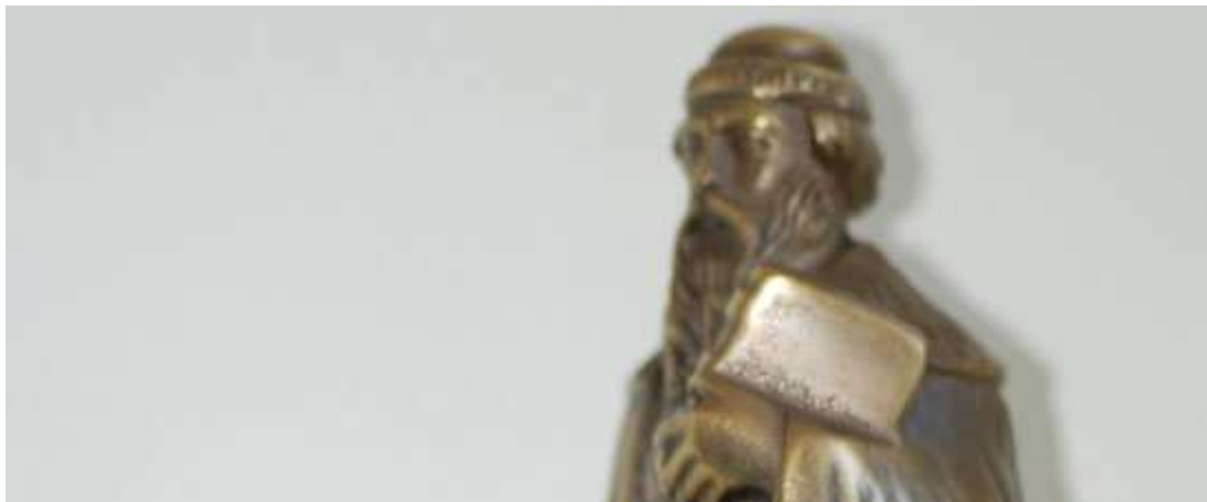
(Bildtext: Gutenberg-Büste der Stadt Mainz)